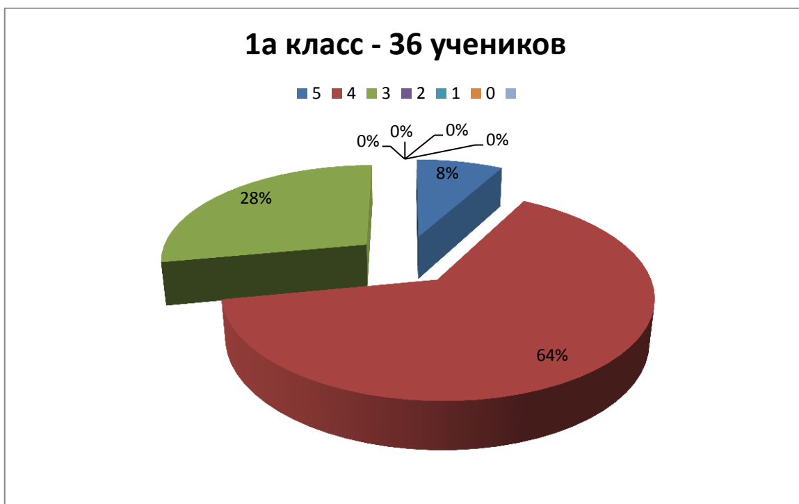
Иллюстрация результатов обследования адаптации детей первых классов к школе