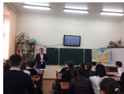
Урок финансовой грамотности

предпринимательских способностей, обеспечивает повышение стандартов качества жизни и финансовой безопасности будущих поколений граждан.