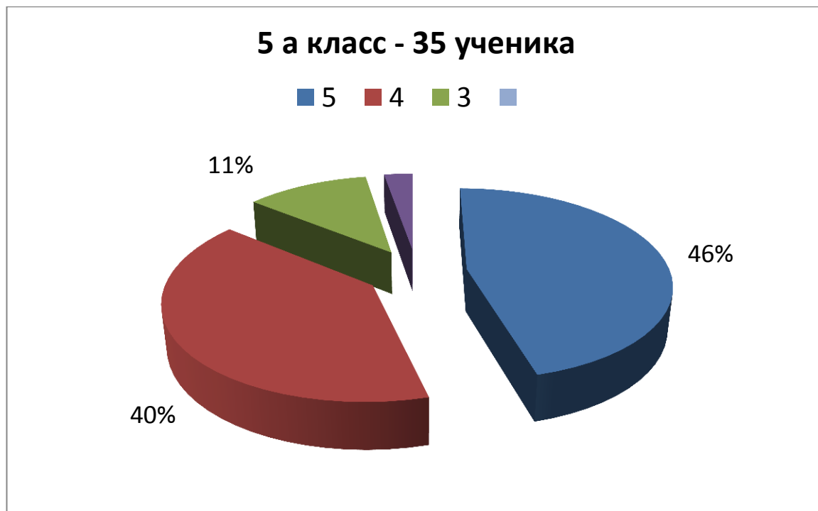
Иллюстрация результатов обследования адаптации детей пятых классов к среднему звену школы