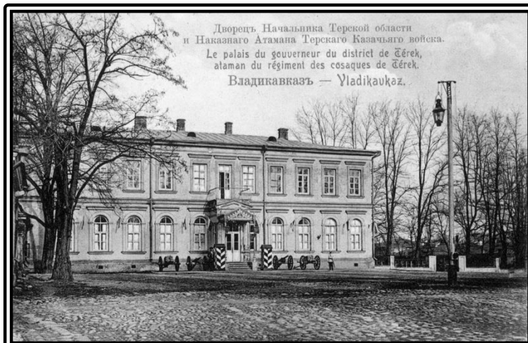
Дворец Начальника Терской области и Наказного Атамана Терского Казачьего войска.