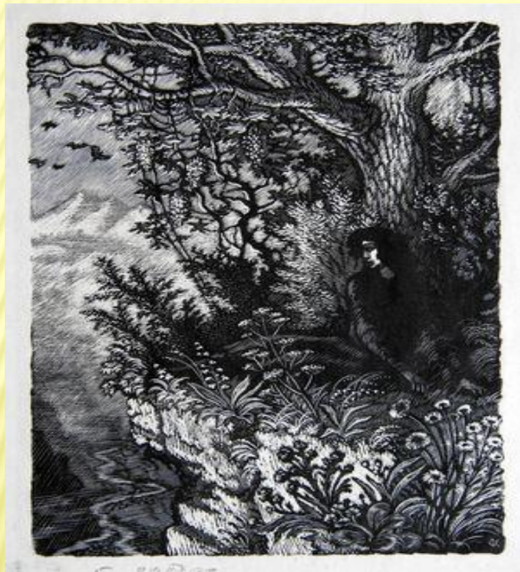
ОБРАЗ МЦЫРИ. «НА ВОЛЕ».