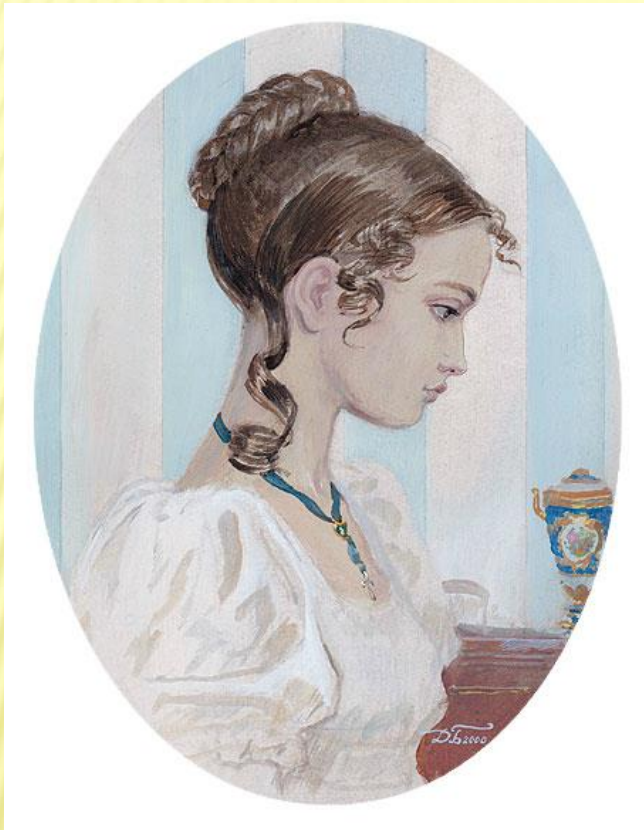
ТАТЬЯНА. «ЕВГЕНИЙ ОНЕГИН». Д. БЕЛЮКИН.